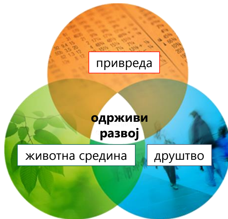
Компоненте одрживог развоја