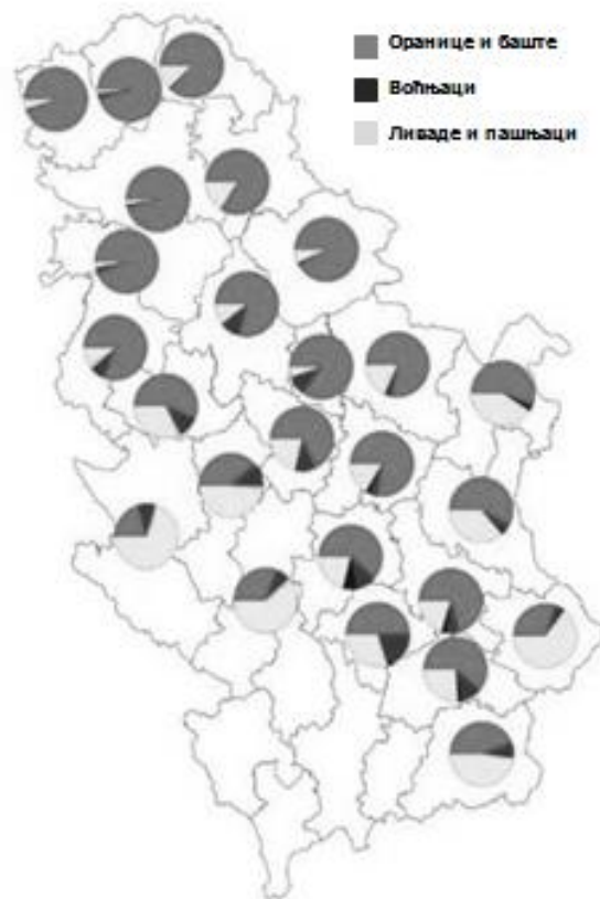
Карта 2. – Пољопривредно земљиште начину коришћења (по окрузима)

а) Процент пољопривредних површина највећи је у окрузима који се налазе на простору Војводине и према начину коришћења претежно су заступљене оранице и баште.