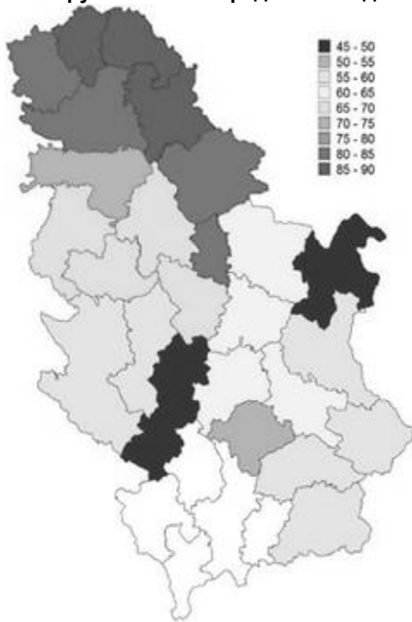
Карта 1. – Процент пољопривредних површина у према односу на укупну површину (по окрузима)